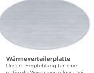
Wärmeverteilerplatte Unsere Empfehlung für eine optimale Wärmeverteilung bei Keramik Caquelons. Ø 15 cm ● Alu 32045