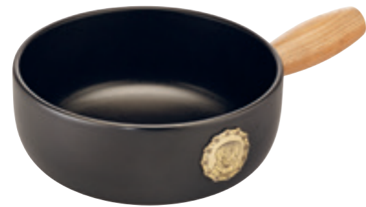
Caquelon Induktion Bernhardiner Nur solange Vorrat. Ø 23 cm ● Schwarz 32266