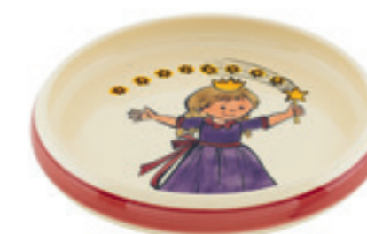
Kinderteller Prinzessin Ø 18 cm hoher Rand 39519