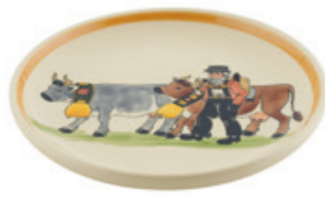
Teller Appenzell Ø 21 cm 39129