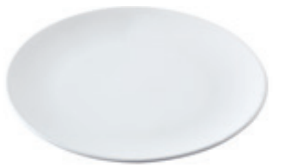
Teller Classic einzeln Ø 20 cm ○ Weiss 32223