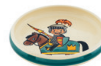
Kinderteller Ritter Ø 18 cm hoher Rand 39522