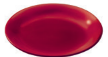
Teller Classic einzeln Ø 19 cm ● Rot 32091