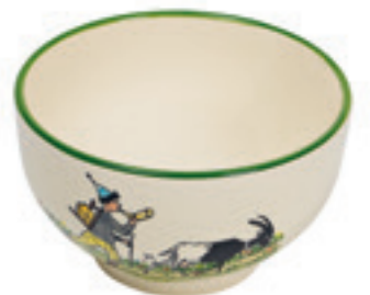
Mülschale Ursli mit Geiss Ø 14 cm 39484