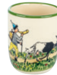
Kindertasse Ursli mit Geiss 2.0 dl 39341