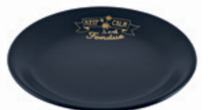
Teller Handlettering einzeln Ø 19 cm ● Schwarz 32258