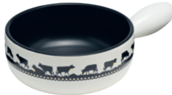
Caquelon Induktion Goldglocke Ø 23 cm ● Weiss/Schwarz 32218/32288**