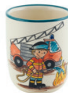
Kindertasse Feuerwehrmann 2.0 dl 39323