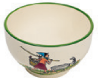
Mülschale Flurina mit Geiss Ø 14 cm 39481