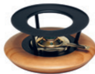
Rechaud* Kirschholz mit Goldbrenner ● Schwarz/Kirschholz 32042