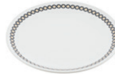
Teller Goldglocke einzeln Ø 20 cm ○ Weiss 32253