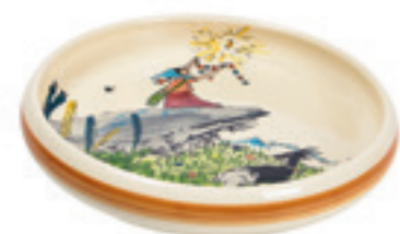
Kinderteller Flurina auf Fels Ø 18 cm hoher Rand 39516