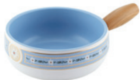
Caquelon Induktion Schwinger Ø 23 cm ○ Weiss 32233