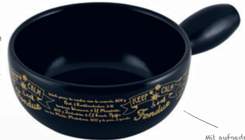
Caquelon Handlettering Ø 22 cm ● Schwarz 32257