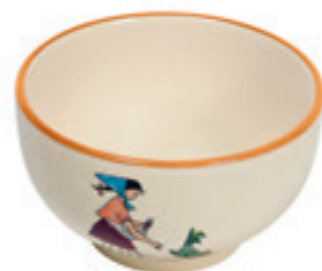
Mülschale Flurina mit Huhn Ø 14 cm 39486