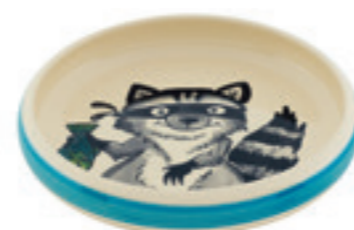
Kinderteller Waschbär Ø 18 cm hoher Rand 39527