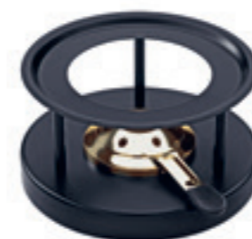
Rechaud* Simple mit Goldbrenner ● Schwarz pulverbeschichtet 32263