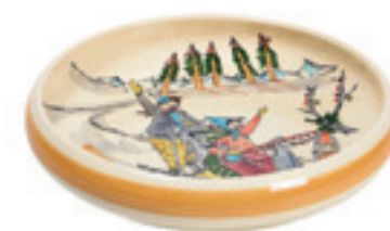
Kinderteller Schlittenfahrt Ø 18 cm hoher Rand 39508