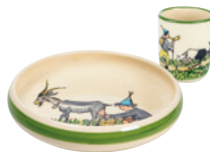
Kinderset Ursli mit Geiss Kinderteller Ø 18 cm hoher Rand und Kindertasse 2.0dl 39541