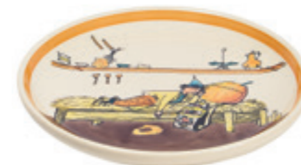
Teller Ursli schläft auf Glocke Ø 21 cm 39121