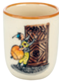
Kindertasse Urqli am Tor 2.0 dl 39343