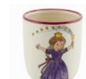
Kindertasse Prinzessin 2.0 dl 39321