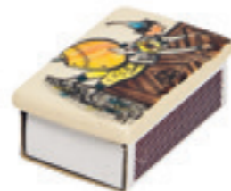
Zündholzschachtel klein Urqli am Tor 6.3x4 cm 39702