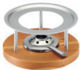
Rechaud* Melchterli ● Grau/Kirschholz 32059