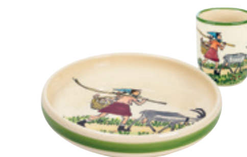
Kinderset Flurina mit Geiss Kinderteller Ø 18 cm hoher Rand und Kindertasse 2.0dl 39542