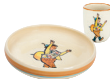
Kinderset Ursli Kinderteller Ø 18 cm hoher Rand und Kindertasse 2.0dl 39540