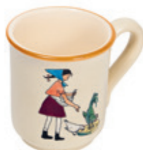
Tasse Flurina mit Huhn 2.8 dl 39459