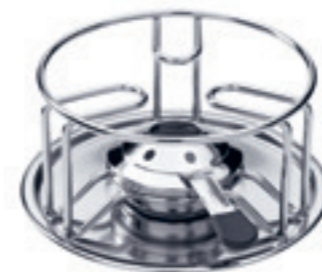
Rechaud* Wire ● Edelstahl 32017