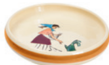
Kinderteller Flurina mit Huhn Ø 18 cm hoher Rand 39517