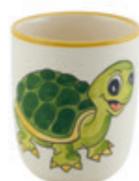
Kindertasse Schildkröte 2.0 dl 39328