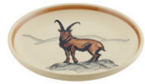
Teller Steinbock Ø 21 cm 39128