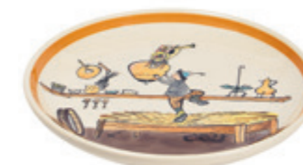
Teller Ursli holt Glocke Ø 21 cm 39119