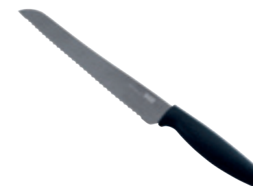
COLORI® Titanium Brotmesser 33 cm ● Graphit 26584