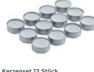
Kerzenset 12 Stück für Kuhn Rikon Raclette-Sets 12 Stück 32250