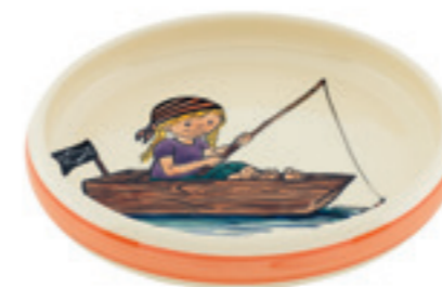
Kinderteller Piratin Ø 18 cm hoher Rand 39518