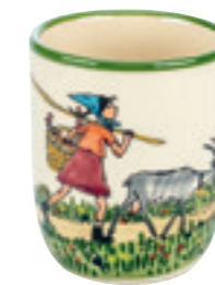
Kindertasse Flurina mit Geiss 2.0 dl 39342