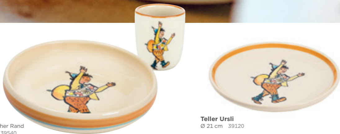
Teller Ursli Ø 21 cm 39120