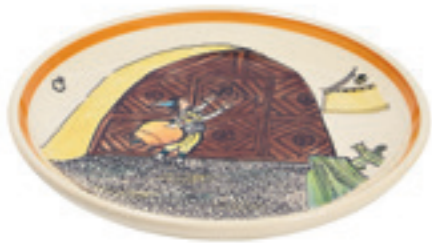
Teller Urqli am Tor Ø 21 cm 39116

z.B. zum Servieren von Suppen, Salat oder Früchten