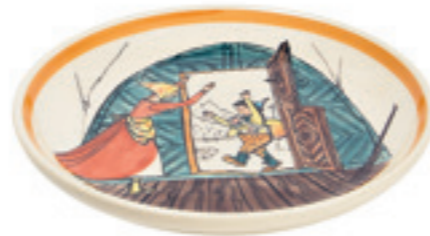
Teller Urqli kommt heim Ø 21 cm 39118