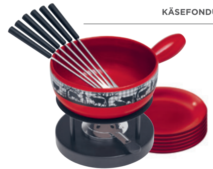
Käsefondueset Karo Kuh Inkl. Caquelon, Rechaud Simple*, 6 Kunststoffgabeln schwarz, 6 rote Teller, Pastenbrenner gefüllt. Ø 22 cm ● Rot 32047