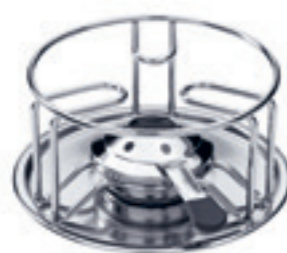
Rechaud* Wire ● Edelstahl 32017