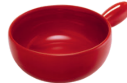
Keramik Caquelon Classic Ø 22 cm ● Rot 32185