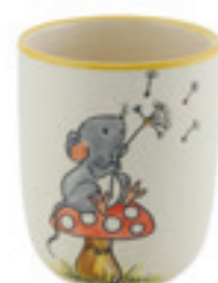
Kindertasse Maus 2.0 dl 39326