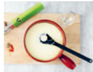
Erhitzen und dabei ständig rühren.