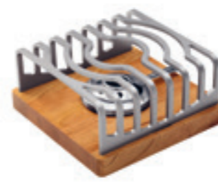
Rechaud* Modern ● Silber/Kirschholz 32098