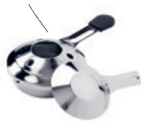
Pastenbrenner gefüllt mit Brennpaste 32046