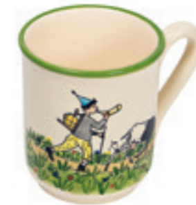
Tasse Ursli mit Geiss 2.8 dl 39455