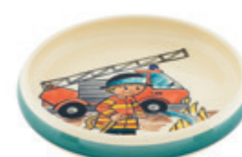
Kinderteller Feuerwehrmann Ø 18 cm hoher Rand 39521