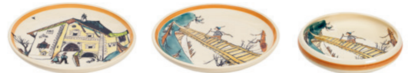
Kinderteller Ursli auf dem Steg Ø 18 cm hoher Rand 39512