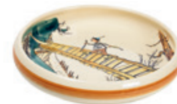
Kinderteller Ursli auf dem Steg Ø 18 cm hoher Rand 39512