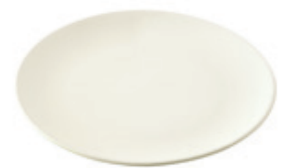
Teller Eierschale Ø 20 cm ● Eierschalenweiss 32240