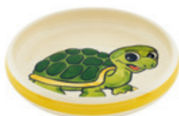
Kinderteller Schildkröte Ø 18 cm hoher Rand 39526