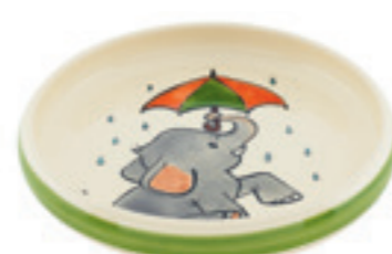
Kinderteller Elefant Ø 18 cm hoher Rand 39525