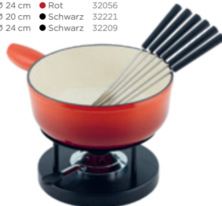
Käsefondueset Induktion Eisenguss inkl. Caquelon, Rechaud Simple*, 6 Kunststoffgabeln schwarz, Pastenbrenner gefüllt. Ø 24 cm ● Rot* 32236