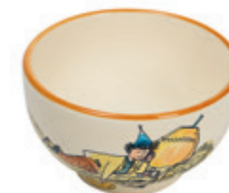
Mülschale Ursli schläft auf Glocke Ø 14 cm 39485