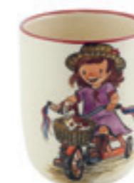
Kindertasse Fahrrad 2.0 dl 39322