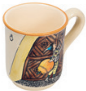
Tasse Urqli am Tor 2.8 dl 39454