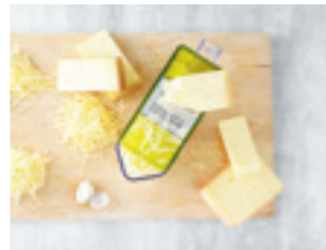
Käse entrinden und auf der Küchenreibe grob reiben

Weitere Informationen und noch mehr Fondue-Sorten aus den natürlü-Tonsteinkellern unter: www.naturlü-ag.ch