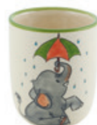
Kindertasse Elefant 2.0 dl 39327