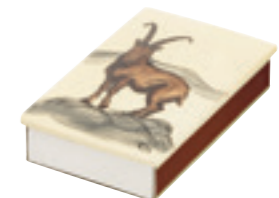
Zündholzschachtel gross Steinbock 11,5 x 7cm 39717