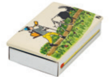
Zündholzschachtel gross Ursli mit Geiss 11.5x7 cm 39716