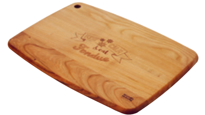
Schneidebrett Handlettering Kirschholz 36 x 25 x 15 cm ● Kirschholz 32259