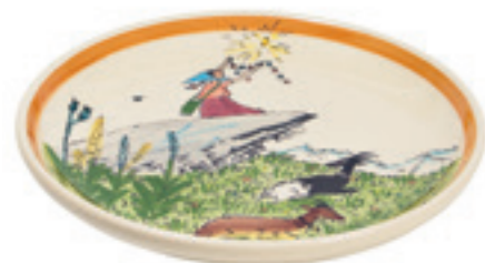
Teller Flurina auf Fels Ø 21 cm 39107

z.B. zum Servieren von Suppen, Salat oder Früchten