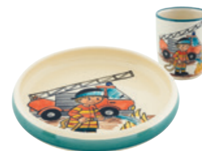
Kinderset Feuerwehr Kinderteller Ø 18 cm hoher Rand und Kindertasse 2.0dl 39550