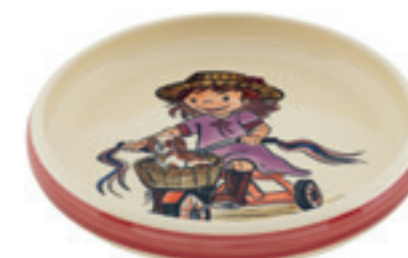
Kinderteller Fahrrad Ø 18 cm hoher Rand 39520