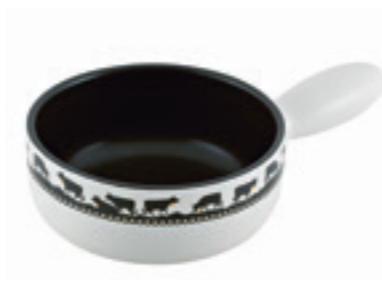
Mini-Caquelon Goldglocke Ø 16 cm ● Weiss/Schwarz 32251