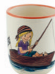
Kindertasse Piratin 2.0 dl 39320