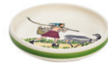
Kinderteller Flurina mit Geiss Ø 18 cm hoher Rand 39502