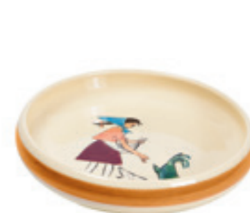
Kinderteller Flurina mit Huhn Ø 18 cm hoher Rand 39517