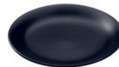
Teller Classic einzeln Ø 20 cm ● Schwarz 32283