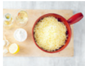
Alle Zutaten in das Caquelon geben.