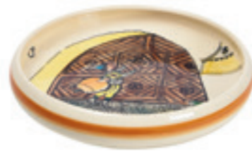
Kinderteller Urqli am Tor Ø 18 cm hoher Rand 39511