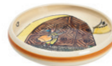
Kinderteller Ursli am Tor Ø 18 cm hoher Rand 39511