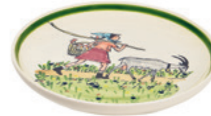
Teller Flurina mit Geiss Ø 21 cm 39125