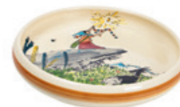
Kinderteller Flurina auf Fels Ø 18 cm hoher Rand 39516