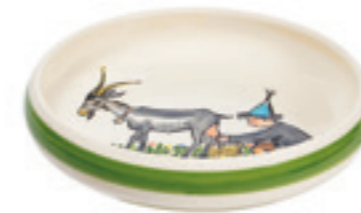
Kinderteller Ursli mit Geiss Ø 18 cm hoher Rand 39514