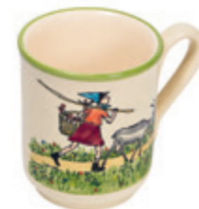
Tasse Flurina mit Geiss 2.8 dl 39450