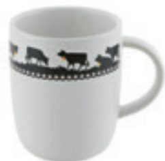
Tasse Goldglocke 2,8 dl ● Weiss/Schwarz 32252