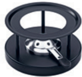
Rechaud* Simple ● Schwarz pulverbeschichtet 32019