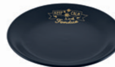
Teller Handlettering einzeln Ø 19 cm ● Schwarz 32258