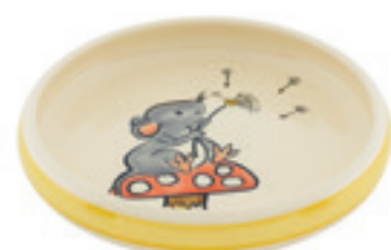
Kinderteller Maus Ø 18 cm hoher Rand 39524