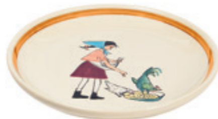
Teller Flurina mit Huhn Ø 21 cm 39127