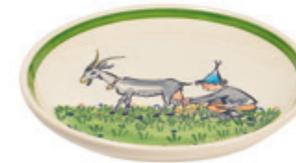
Teller Ursli mit Geiss Ø 21 cm 39126