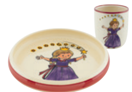
Kinderset Prinzessin Kinderteller Ø 18 cm hoher Rand und Kindertasse 2.0dl 39551