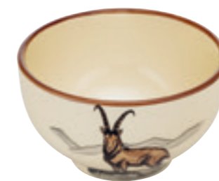
Müslischale Steinbock Ø 14 cm 39487