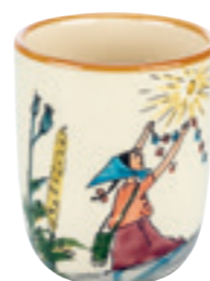
Kindertasse Flurina auf Fels 2.0 dl 39344