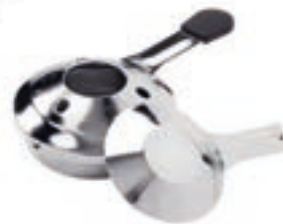
Brûleur à pâte Sans pâte à brûler 32046