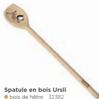
Spatule en bois Ursli