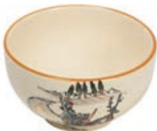
Bol Promenade en luge Ø 14 cm 39482