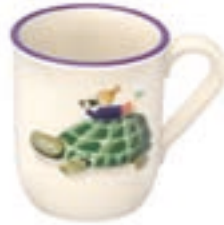
Tasse pour enfant Tortue avec enfant 2.5 dl 39331