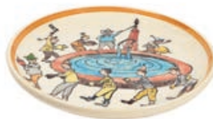
Assiette Danse à la fontaine Ø 21 cm 39106