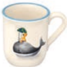
Tasse pour enfant Baleine avec enfant 2.5 dl 39333