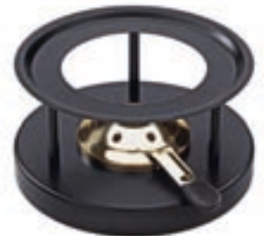
Réchaud* Simple avec brûleur doré ●● noir revêtement par poudre 32263