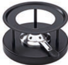
Réchaud* Simple ●● noir revêtement par poudre 32019