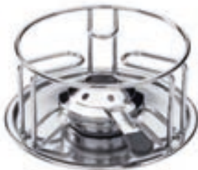
Réchaud* Wire ●● acier inoxydable 32017