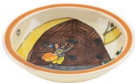
Coupe Ursli au portail Ø 29 cm bord élevé 39012