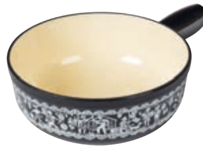
Caquelon induction fonte Fête Nationale Suisse Ø 24 cm ● noir 32322