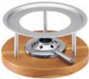
Réchaud* Melchterli ●● gris/bois de cerisier 32059