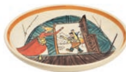
Assiette Ursli rentre à la maison Ø 21 cm 39118