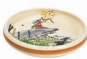
Assiette enfant Flurina sur le rocher Ø 18 cm bord élevé 39516