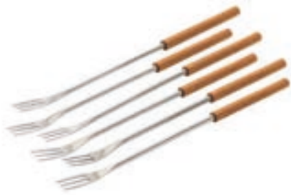
Fourchettes pour fondue au fromage 6 Pièces ● bois de cerisier 32282