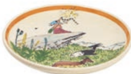
Assiette Flurina sur le rocher Ø 21 cm 39107