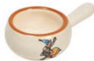
Mini-Caquelon Kirsch Ursli