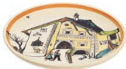
Assiette la maison d'Ursli avec parents Ø 21 cm 39122