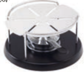
Réchaud* Spécial avec plaque d'aluminium ●● noir/argent 32199