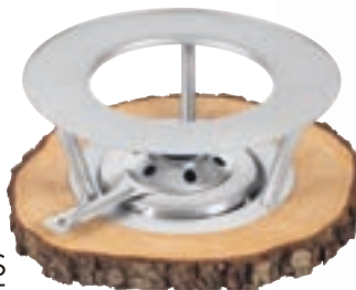
Rechaud* bois d'aulne