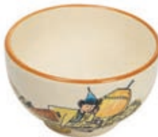
Bol Ursli dort sur la cloche Ø 14 cm 39485