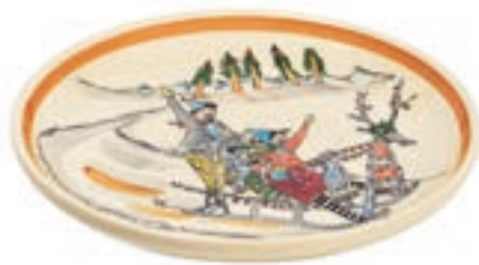
Assiette Promenade en luge Ø 21 cm 39109