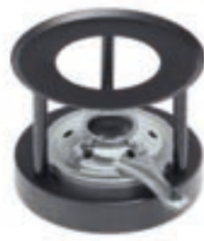
Mini Réchaud* Simple ●● noir revêtement par poudre 32044