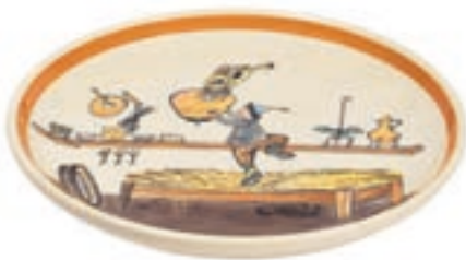
Assiette Ursli cherche la cloche Ø 21 cm 39119