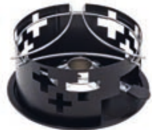
Réchaud* Croix Suisse ●● noir revêtement par poudre 32198