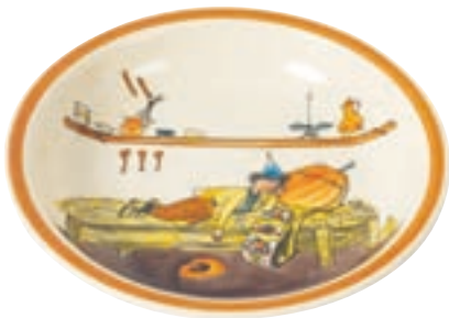
Assiette creuse Ursli dort sur la cloche Ø 21 cm bord élevé 39132