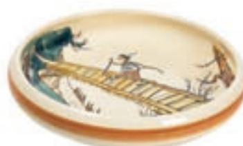
Assiette enfant Ursli sur la passerelle Ø 18 cm bord élevé 39512