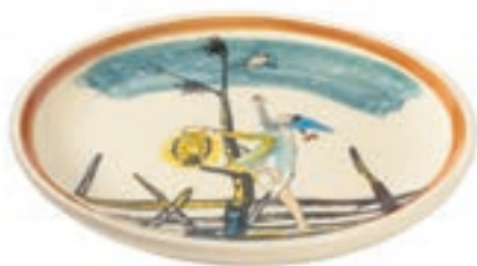
Assiette Flurina avec oiseau sauvage Ø 21 cm 39136