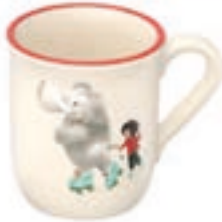
Tasse pour enfant Éléphant avec enfant 2.5 dl 39330