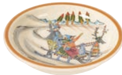
Assiette creuse Promenade en luge Ø 21 cm bord élevé 39134