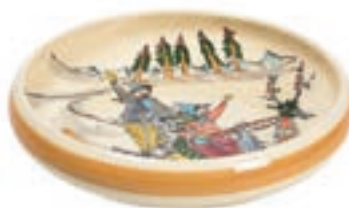
Assiette enfant Promenade en luge Ø 18 cm bord élevé 39508