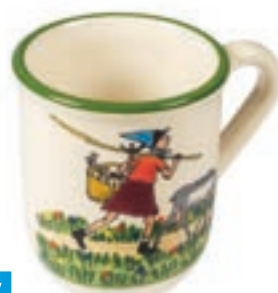
Tasse Flurina avec chèvre 2.5 dl 39462