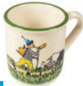
Tasse Ursli avec chèvre 2.5 dl 39467