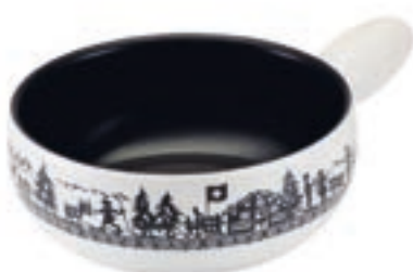
Caquelon Induktion Alpweide Ø 23 cm ● Weiss/Schwarz 32286