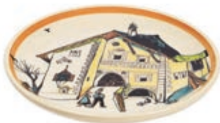
Teller Ursli's Haus mit Eltern Ø 21 cm 39122