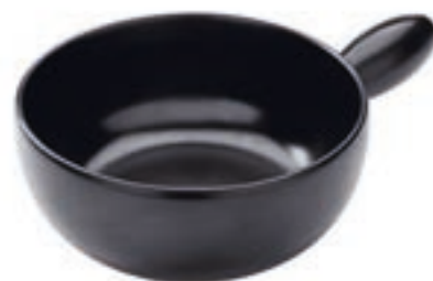
Caquelon Induktion Classic Ø 23 cm ● Schwarz 32284