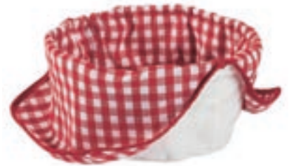
Fondue-Brotsack Karo ●○ Rot/Weiss Baumwolle 32390