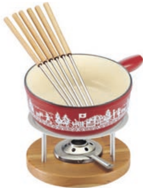
Käsefondue Set Induktion Gusseisen Alpweide inkl. Caquelon, Rechaud Melchterli*, 6 Kirschholzgabeln, Pastenbrenner Ø 24 cm ● Rot 32276