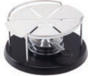
Rechaud Spezial* mit Alu-Wärmeverteilerplatte ●● Schwarz/Silber 32199