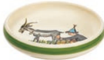
Kinderteller Ursli mit Geiss Ø 18 cm hoher Rand 39514