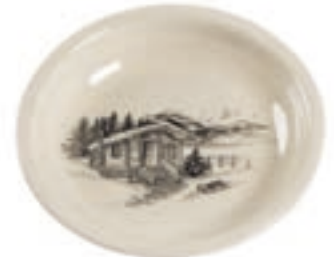
Suppenteller Chalet Ø 21 cm hoher Rand ◯ Cremeweiss 39035