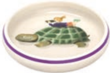
Kinderteller Schildkröte mit Kind Ø 18 cm hoher Rand 39529