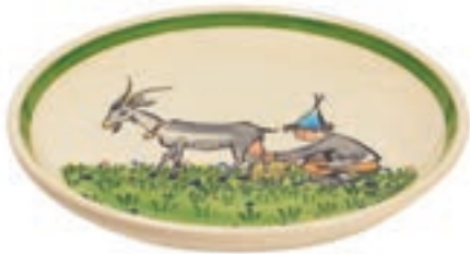
Teller Ursli mit Geiss Ø 21 cm 39126