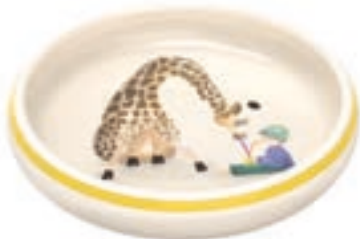
Kinderteller Giraffe mit Kind Ø 18 cm hoher Rand 39530