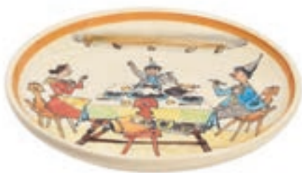
Teller Ursli am Tisch Ø 21 cm 39115