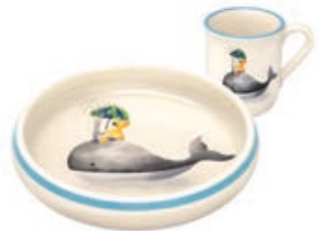
Kinderset Walfisch mit Kind Kinderteller Ø 18 cm hoher Rand und Kindertasse 2.5 dl 39558