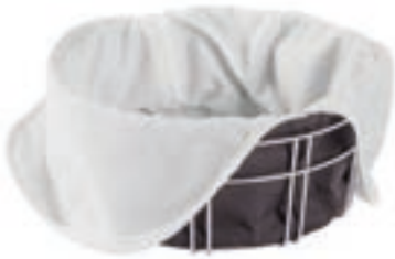
Fondue-Brotkorb Metall ●● Anthrazit Baumwolle/Edelstahl 32391