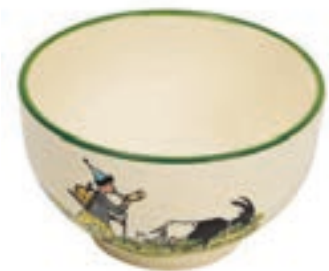
Mülschale Ursli mit Geiss Ø 14 cm 39484