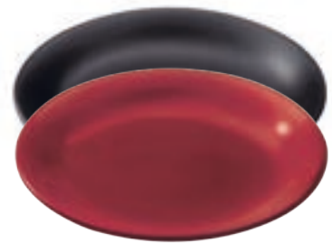
Teller Classic einzeln Ø 19 cm ● Schwarz matt 32214 Ø 19 cm ● Rot matt 32215