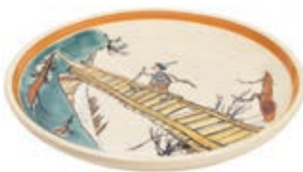
Teller Ursli auf dem Steg Ø 21 cm 39117