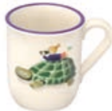
Kindertasse Schildkröte mit Kind 2.5 dl 39331