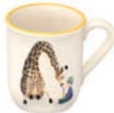
Kindertasse Giraffe mit Kind 2.5 dl 39332