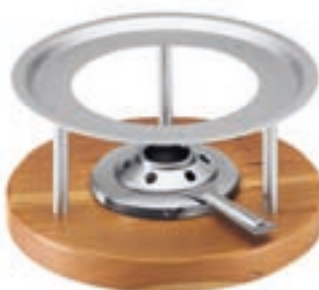
Rechaud Melchterli* ●● Grau/Kirschholz 32059

Caquelon Carigiet Ursli Ø 20 cm 39223 Induktion Ø 17 cm 39203 Ø 20 cm 39204