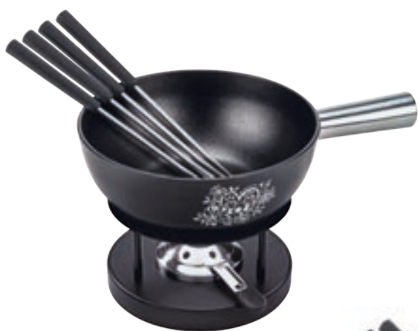
Käsefondue Set Induktion Alpenliebe inkl. Caquelon, Rechaud Simple*, 4 Kunststoffgabeln schwarz, Pastenbrenner Ø 22 cm ● Schwarz 32275