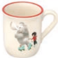
Kindertasse Elefant mit Kind 2.5 dl 39330