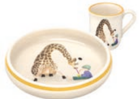
Kinderset Giraffe mit Kind Kinderteller Ø 18 cm hoher Rand und Kindertasse 2.5 dl 39557