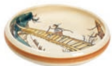
Kinderteller Ursli auf dem Steg Ø 18 cm hoher Rand 39512