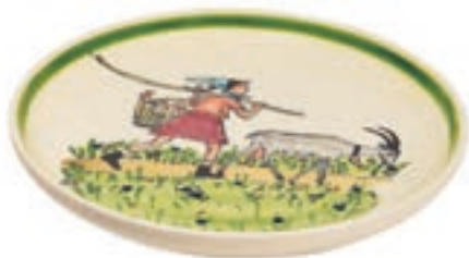
Teller Flurina mit Geiss Ø 21 cm 39125