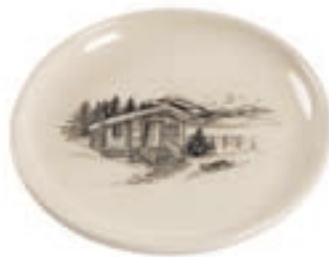
Teller Chalet Ø 21 cm ◯ Cremeweiss 39034