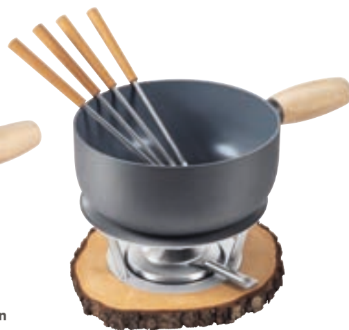
Käsefondue Set Induktion Alpine inkl. Rechaud Erle*, 4 Buchenholzgabeln, Pastenbrenner Ø 20 cm ● Dunkelgrau 32311