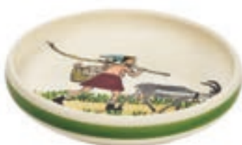
Kinderteller Flurina mit Geiss Ø 18 cm hoher Rand 39502