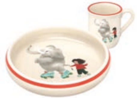
Kinderset Elefant mit Kind Kinderteller Ø 18 cm hoher Rand und Kindertasse 2.5 dl 39555