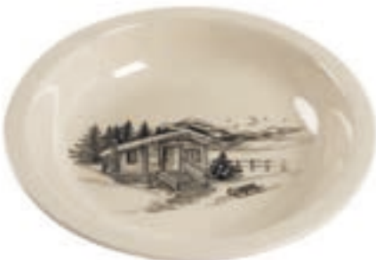
Schale Chalet Ø 29 cm hoher Rand ◯ Cremeweiss 39031