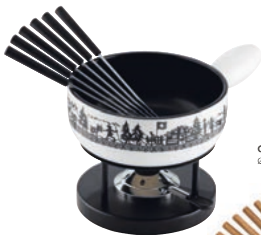
Käsefondue Set Induktion Alpweide inkl. Caquelon, Rechaud Simple*, 6 Kunststoffgabeln schwarz, Pastenbrenner Ø 23 cm ● Weiss/Schwarz 32287