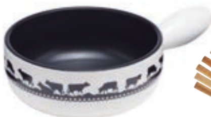
Caquelon Induktion Goldglocke Ø 23 cm ● Weiss/Schwarz 32288