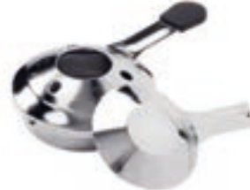
Pastenbrenner ohne Brennpaste 32046