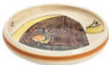
Kinderteller Ursli am Tor Ø 18 cm hoher Rand 39511