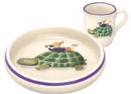
Kinderset Schildkröte mit Kind Kinderteller Ø 18 cm hoher Rand und Kindertasse 2.5 dl 39556