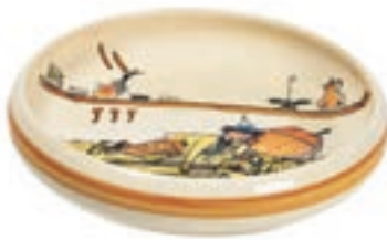
Kinderteller Ursli schläft auf Glocke Ø 18 cm hoher Rand 39515