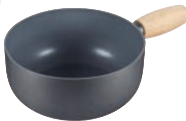
Caquelon Aluminium Induktion Ø 20 cm ● Dunkelgrau 32314