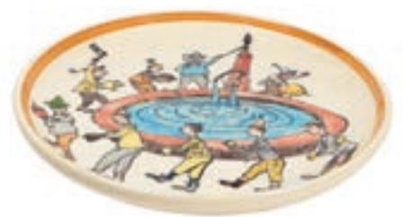
Teller Ursli Tanz am Brunnen Ø 21 cm 39106