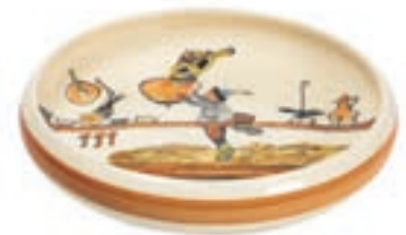
Kinderteller Ursli holt Glocke Ø 18 cm hoher Rand 39513