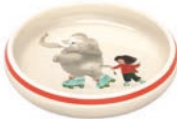
Kinderteller Elefant mit Kind Ø 18 cm hoher Rand 39528