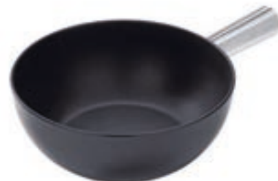
Caquelon Aluminium Induktion Ø 22 cm ● Schwarz 32007