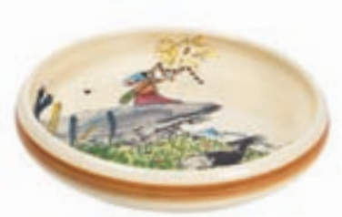
Kinderteller Flurina auf Fels Ø 18 cm hoher Rand 39516