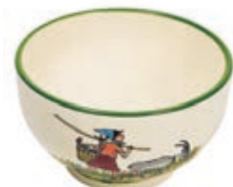
Mülschale Flurina mit Geiss Ø 14 cm 39481