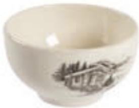
Müslischale Chalet Ø 14 cm ◯ Cremeweiss 39032