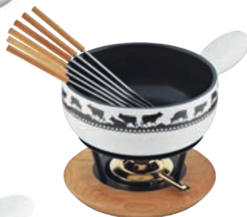
Käsefondue Set Induktion Goldglocke inkl. Caquelon, Rechaud Kirschholz*, 6 Kirschholzgabeln, Pastenbrenner Ø 23 cm ● Weiss/Schwarz 32289 (solange Vorrat)