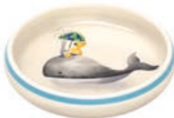
Kinderteller Walfisch mit Kind Ø 18 cm hoher Rand 39531