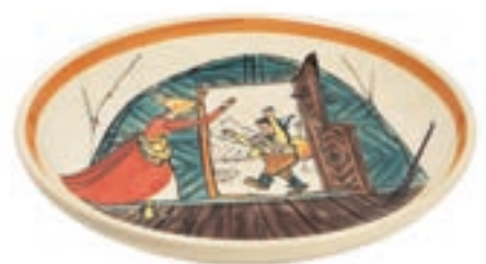
Teller Ursli daheim mit Mutter Ø 21 cm 39118