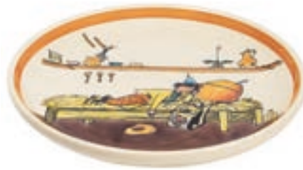
Teller Ursli schläft auf Glocke Ø 21 cm 39121