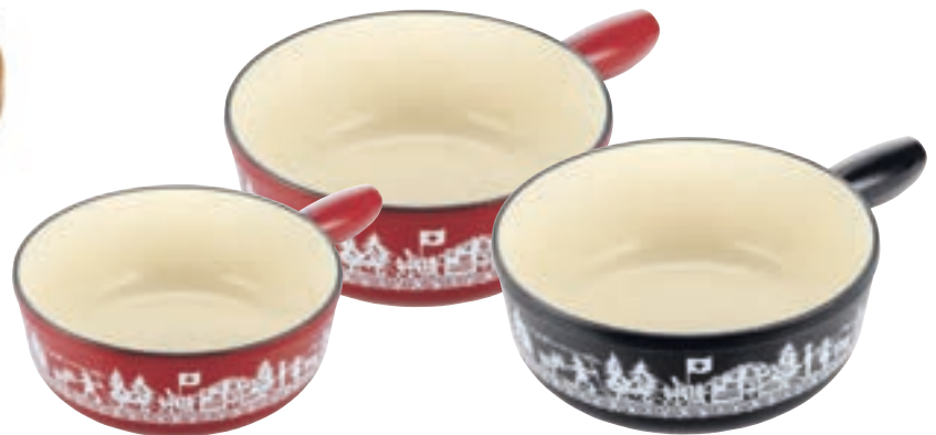
Caquelon Induktion Gusseisen Alpweide Ø 24 cm ● Schwarz 32299 Ø 24 cm ● Rot 32273 Ø 17 cm ● Rot 32331