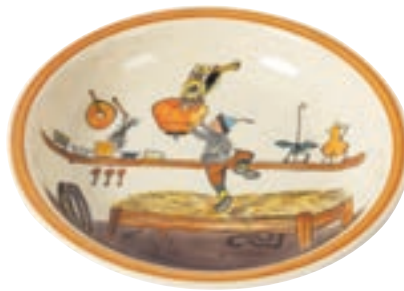
Suppenteller Ursli holt Glocke Ø 21 cm hoher Rand 39130