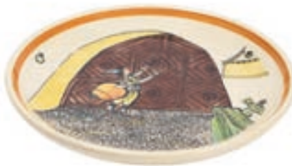
Teller Ursli am Tor Ø 21 cm 39116