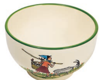
Mülschale Flurina mit Geiss Ø 14 cm 39481