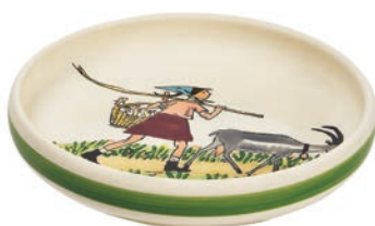
Kinderteller Flurina mit Geiss Ø 18 cm hoher Rand 39502