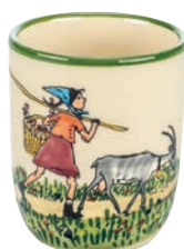
Kindertasse Flurina mit Geiss 2.0 dl 39342