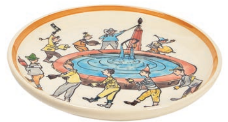
Teller Ursli Tanz am Brunnen Ø 21 cm 39106