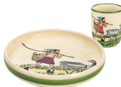
Kinderset Flurina mit Geiss Kinderteller Ø 18 cm hoher Rand und Kindertasse 2.0 dl 39542