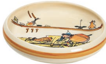
Kinderteller Ursli schläft auf Glocke Ø 18 cm hoher Rand 39515