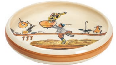
Kinderteller Ursli holt Glocke Ø 18 cm hoher Rand 39513