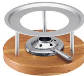
Rechaud Melchterli* ●● Grau/Kirschholz 32059