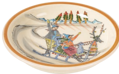
Suppenteller Schlittenfahrt Ø 21 cm hoher Rand 39134