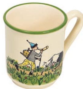
Tasse Ursli mit Geiss 4.5 dl 39455