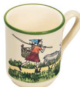
Tasse Flurina mit Geiss 4.5 dl 39450