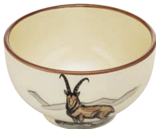
Mülschale Steinbock Ø 14 cm 39487