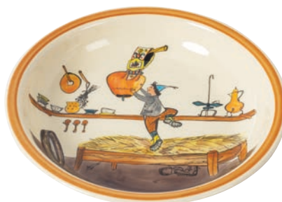
Suppenteller Ursli holt Glocke Ø 21 cm hoher Rand 39130