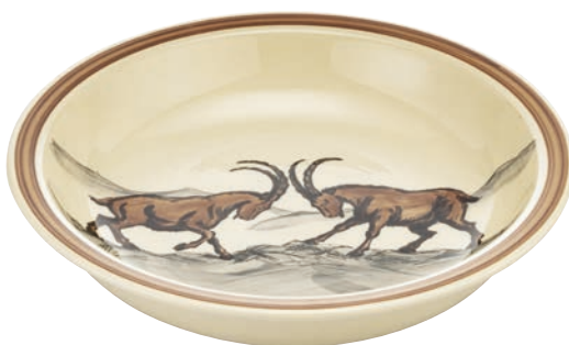
Schale Steinbock Ø 29 cm hoher Rand 39016