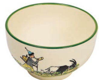
Mülschale Ursli mit Geiss Ø 14 cm 39484