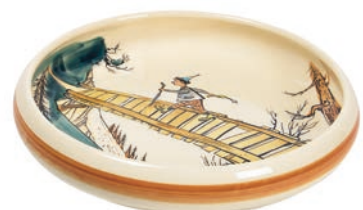
Kinderteller Ursli auf dem Steg Ø 18 cm hoher Rand 39512