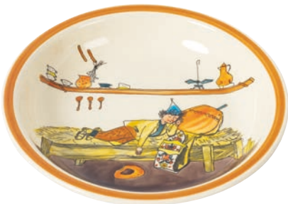
Suppenteller Ursli schläft auf Glocke Ø 21 cm hoher Rand 39132