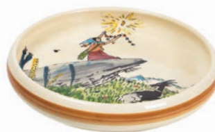
Kinderteller Flurina auf Fels Ø 18 cm hoher Rand 39516