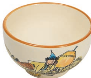
Mülschale Ursli schläft auf Glocke Ø 14 cm 39485