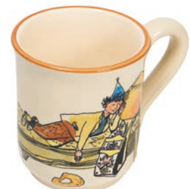
Tasse Ursli schläft auf Glocke 4.5 dl 39456