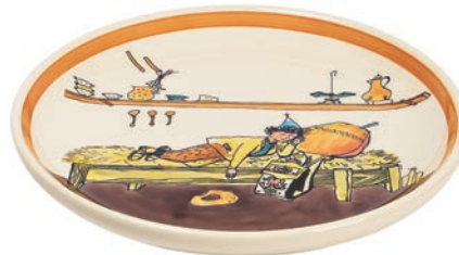
Teller Ursli schläft auf Glocke Ø 21 cm 39121