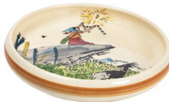
Kinderteller Flurina auf Fels Ø 18 cm hoher Rand 39516