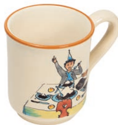
Tasse Ursli am Tisch 4.5 dl 39453