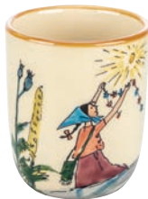
Kindertasse Flurina auf Fels 2.0 dl 39344