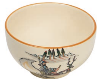
Mülschale Schlittenfahrt Ø 14 cm 39482