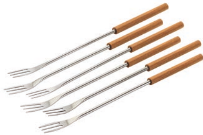
Käsefonduegabeln 6 Stück ● Kirschholz 32282