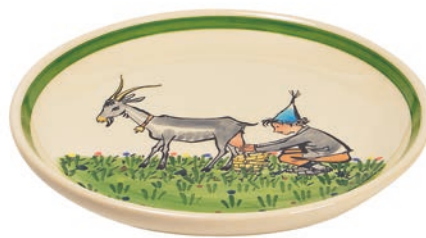
Teller Ursli mit Geiss Ø 21 cm 39126