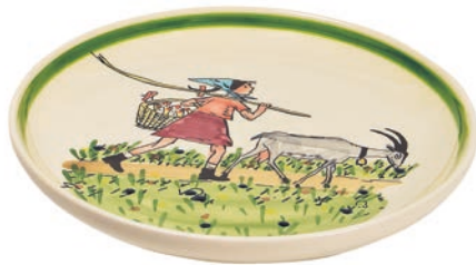
Teller Flurina mit Geiss Ø 21 cm 39125