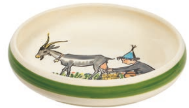
Kinderteller Ursli mit Geiss Ø 18 cm hoher Rand 39514