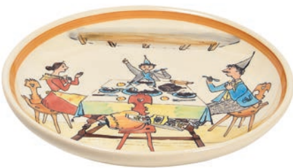
Teller Ursli am Tisch Ø 21 cm 39115