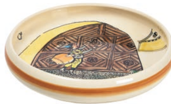
Kinderteller Ursli am Tor Ø 18 cm hoher Rand 39511