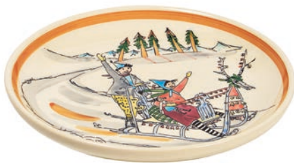
Teller Schlittenfahrt Ø 21 cm 39109