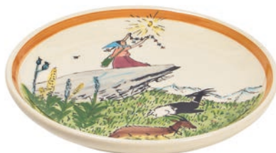
Teller Flurina auf Fels Ø 21 cm 39107