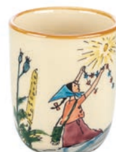
Kindertasse Flurina auf Fels 2,0 dl 39344