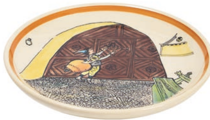
Teller Ursli am Tor Ø 21 cm 39116