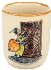
Kindertasse Ursli am Tor 2.0 dl 39343