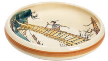
Kinderteller Ursli auf dem Steg Ø 18 cm hoher Rand 39512