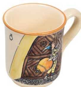
Tasse Ursli am Tor 4,5 dl 39454