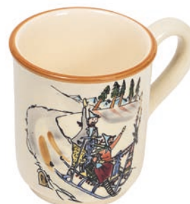
Tasse Schlittenfahrt 4.5 dl 39451