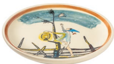
Teller Flurina mit Wildvögelein Ø 21 cm 39136