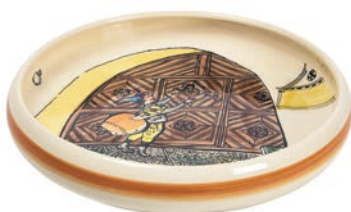
Kinderteller Ursli am Tor Ø 18 cm hoher Rand 39511