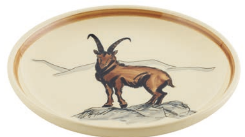
Teller Steinbock Ø 21 cm 39128