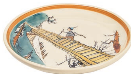
Teller Ursli auf dem Steg Ø 21 cm 39117