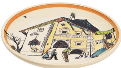
Teller Ursli's Haus mit Eltern Ø 21 cm 39122