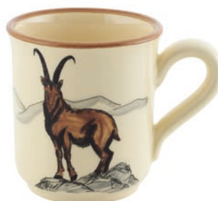
Tasse Steinbock 4,5 dl 39460