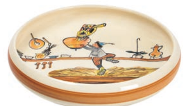
Kinderteller Ursli holt Glocke Ø 18 cm hoher Rand 39513