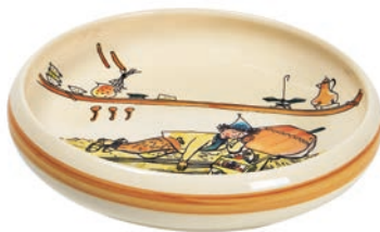
Kinderteller Ursli schläft auf Glocke Ø 18 cm hoher Rand 39515