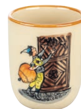
Kindertasse Ursli am Tor 2,0 dl 39343