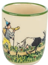
Kindertasse Ursli mit Geiss 2.0 dl 39341