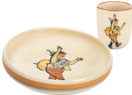
Kinderset Ursli Kinderteller Ø 18 cm hoher Rand und Kindertasse 2.0 dl 39540