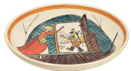
Teller Ursli daheim mit Mutter Ø 21 cm 39118