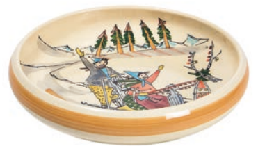
Kinderteller Schlittenfahrt Ø 18 cm hoher Rand 39508