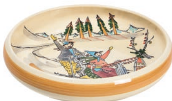
Kinderteller Schlittenfahrt Ø 18 cm hoher Rand 39508