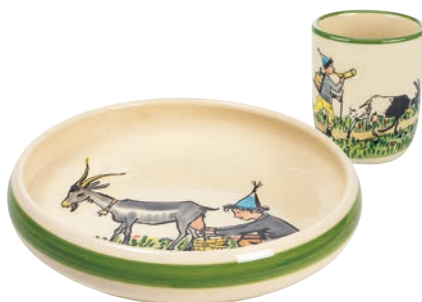
Kinderset Ursli mit Geiss Kinderteller Ø 18 cm hoher Rand und Kindertasse 2.0 dl 39541