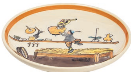
Teller Ursli holt Glocke Ø 21 cm 39119