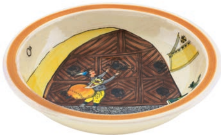
Schale Ursli am Tor Ø 29 cm hoher Rand 39012