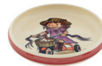
Tasse enfant Bicyclette Ø 18 cm bord élevé 39520