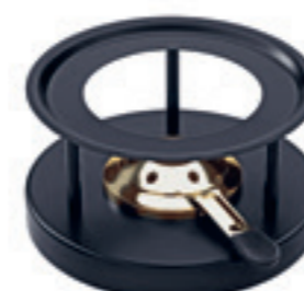
Réchaud* Simple avec brûleur d'or ● noir évêtement par poudre 32263