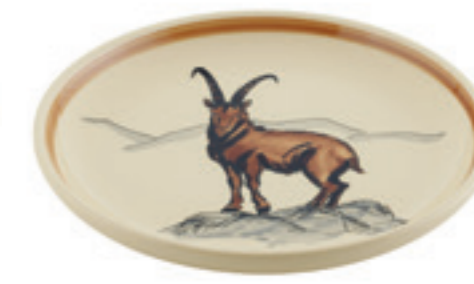
Assiette Bouquetin Ø 21 cm 39128