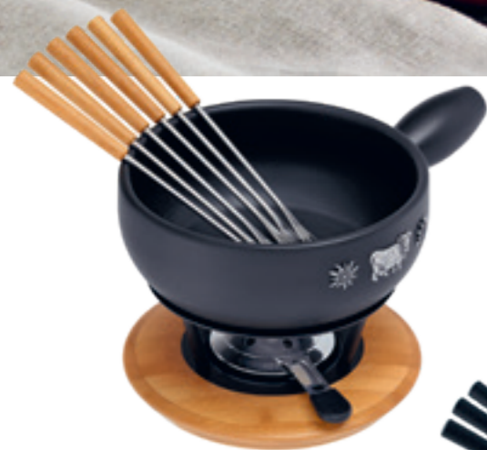
Fondue au fromage Set Alpina Induction inclu: Caquelon, réchaud bois de pin*, 6 fourchettes bambou, pâte à brûleur garni. Ø 23 cm ● noir/décor applications en acier fin* 32089/32285**