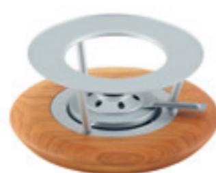
Réchaud* en cerisier avec brûleur à pâte argenté mat ● argent/bois de cerisier 32239