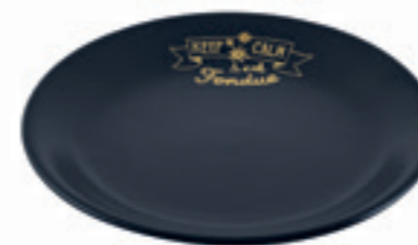
Assiette Handlettering Ø 19 cm ● noir 32258