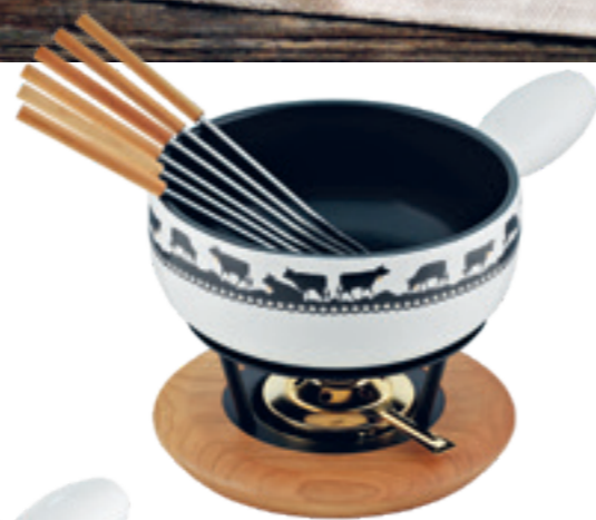
Fondue au fromage Set Induction Goldglocke inclu: Caquelon, réchaud bois de pin*, 6 fourchettes en bois de cerisier, brûleur à pâte garni. Ø 23 cm ○● blanc/noir 32243/32289**