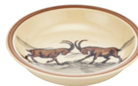
Coupe Bouquetin Ø 29 cm bord élevé 39016