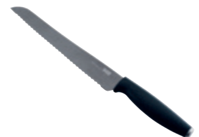
COLORI® Titanium couteau à pain 33 cm ● graphite 26584

instagram.com/kuhnriconschweiz facebook.com/kuhnrikon