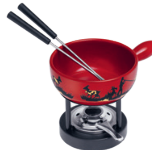
Mini-Fondue au fromage Set Alpes pour 2 personnes inclu: Caquelon, mini-réchaud*, 2 fourchettes en matière synthétique noires, pâte à brûleur garni. Ø 16 cm ● rouge* 32033