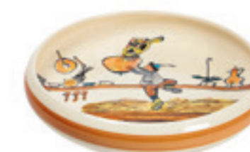
Assiette enfant Ursli cherche la cloche Ø 18 cm bord élevé 39513