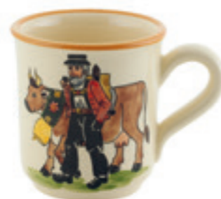
Tasse Appenzell 2.8 dl 39461