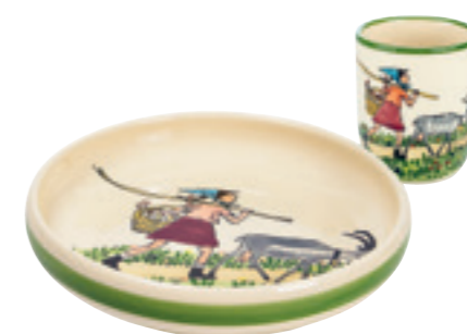
Set pour enfant Flurina avec chèvre Assiette enfant Ø 18 cm bord élevé et tasse enfant 2.0 dl 39542