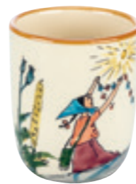
Tasse enfant Flurina sur le rocher 2.0 dl 39344