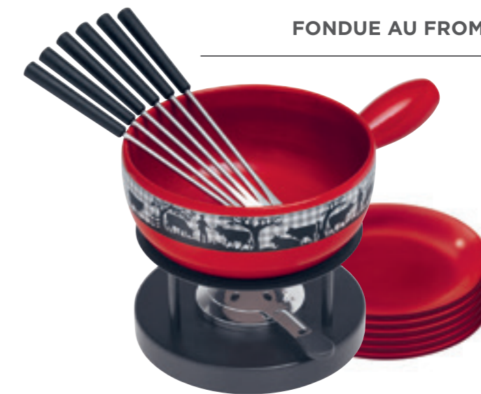
Fondue au fromage Set Carreaux Vache inclu: Caquelon, réchaud Simple*, 6 fourchettes en matière synthétique noires, pâte à brûleur garni. Ø 22 cm ● rouge 32047