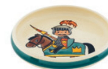
Assiette enfant Chevalier Ø 18 cm bord élevé 39522