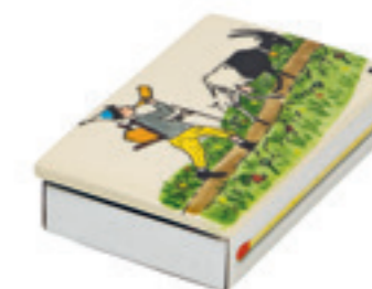
Boîte d'allumettes grande Ursli avec chèvre 11.5x7 cm 39716