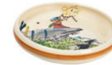
Assiette enfant Flurina sur le rocher Ø 18 cm bord élevé 39516