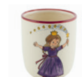
Tasse enfant Princesse 2.0 dl 39321