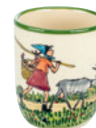
Tasse enfant Flurina avec chèvre 2.0 dl 39342