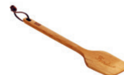
Spatule en cerisier Handlettering bois de cerisier 30 cm ● bois de cerisier 32260