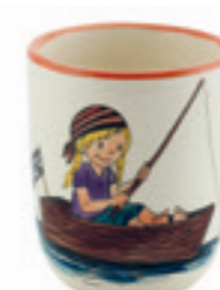
Tasse enfant Pirate fille 2.0 dl 39320