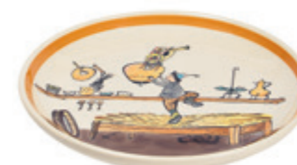
Assiette Ursli cherche la cloche Ø 21 cm 39119