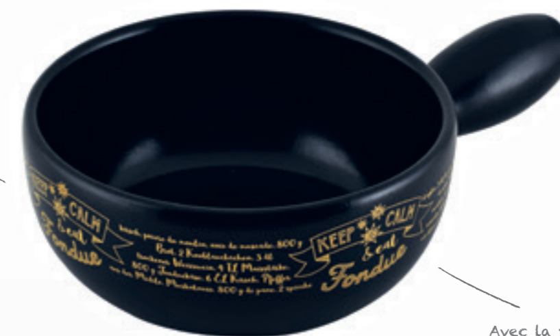
Caquelon Handlettering Ø 22 cm ● noir 32257