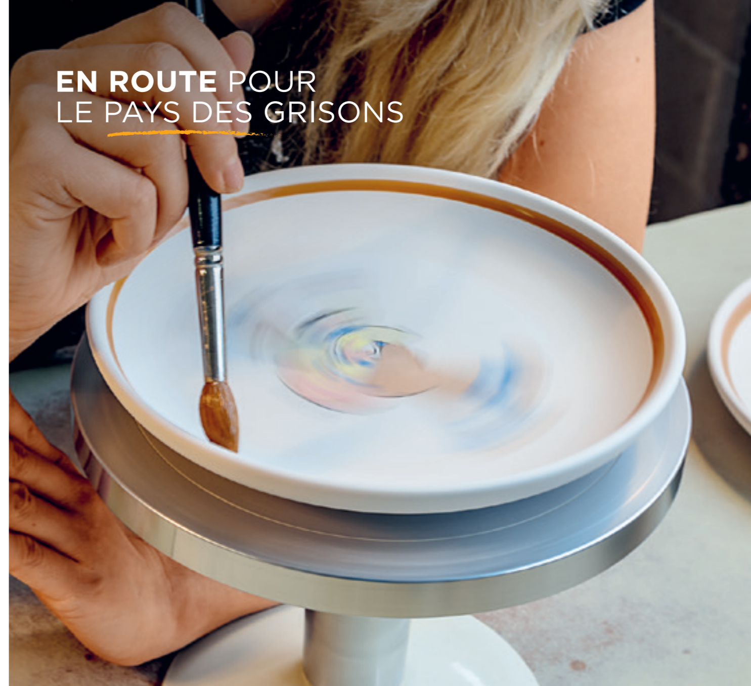
Set pour enfant Ursli Assiette enfant Ø 18 cm bord élevé et tasse enfant 2.0 dl 39540