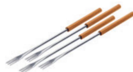
Fourchettes pour Fondue au fromage et à la viande 4 pièces ● bois de cerisier 32099