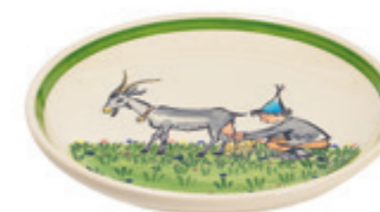
Assiette Ursli avec chèvre Ø 21 cm 39126