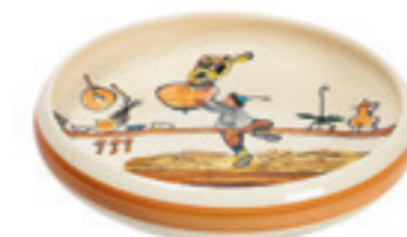
Assiette enfant Ursli cherche la cloche Ø 18 cm bord élevé 39513