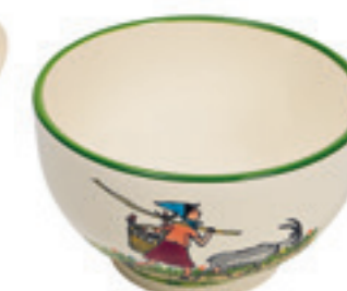
Bol Flurina avec chèvre Ø 14 cm 39481