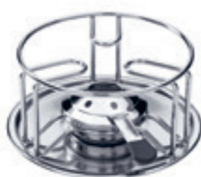
Rechaud* Wire ● acier inoxydable 32017