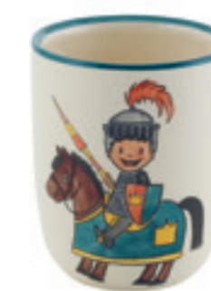
Tasse enfant Chevalier 2.0 dl 39324