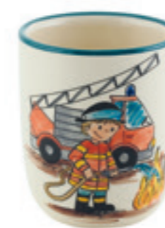
Tasse enfant Pompier 2.0 dl 39323