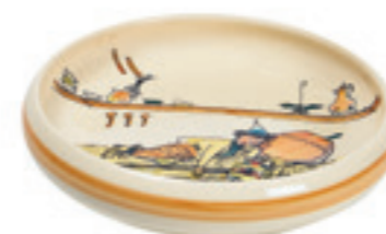
Assiette enfant Ursli dort sur la cloche Ø 18 cm bord élevé 39515