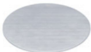
Plaque de répartition de la chaleur Notre suggestion pour une diffusion optimale de la chaleur pour des caquelons en céramique. Ø 15 cm ● Alu 32045