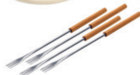
Fondue au fromage Set Schellenursli BASIC 10 pièces inclu: Caquelon pour 4 personnes, 4 fourchettes en bois de cerisier, réchaud Melchterli, 4 assiettes (sujets selon image), brûleur à pâte garni. Ø 20 cm 39909