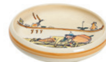
Assiette enfant Ursli dort sur la cloche Ø 18 cm bord élevé 39515