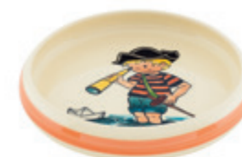
Assiette enfant Pirate garçon Ø 18 cm bord élevé 39523