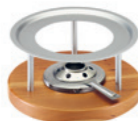
Rechaud* Melchterli ● gris/bois de cerisier 32059