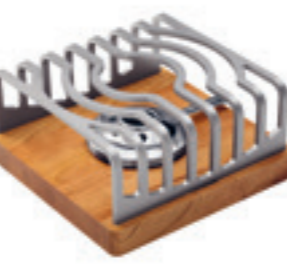
Rechaud* Modern ● argent/bois de cerisier 32098