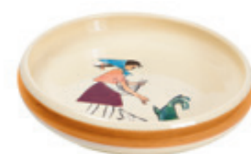
Assiette enfant Flurina Ø 18 cm bord élevé 39517