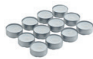
Set de bougies pour les sets raclettes Kuhn Rikon 12 pièces 32250