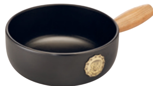
Caquelon Saint-Bernard Induction Disponible jusqu'à épuisement des stocks Ø 23 cm ● noir 32266