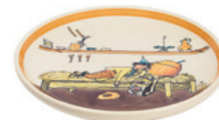
Assiette Ursli dort sur la cloche Ø 21 cm 39121