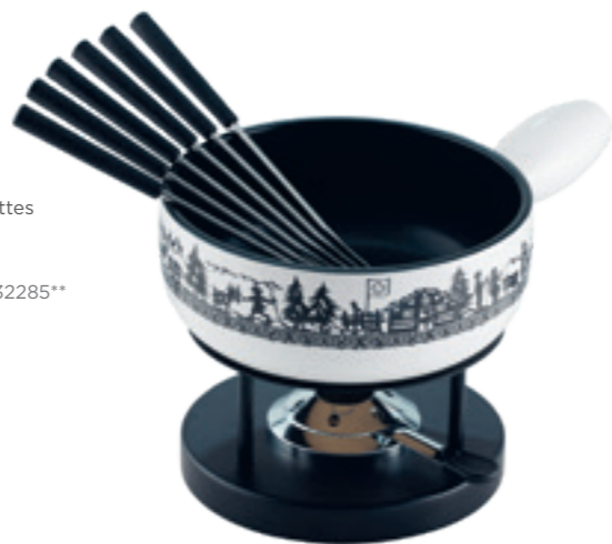
Fondue au fromage Set Alpweide Induction inclu: Caquelon, réchaud Simple*, 6 fourchette en matière synthétique noires, pâte à brûleur garni. Ø 23 cm ●○ noir/blanc 32287