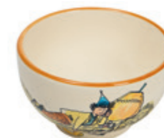
Bol Ursli dort sur la cloche Ø 14 cm 39485