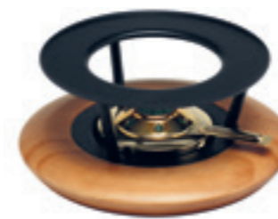
Réchaud* en cerisier avec brûleur d'or ● noir/bois de cerisier 32042