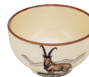
Bol Bouquetin Ø 14 cm 39487