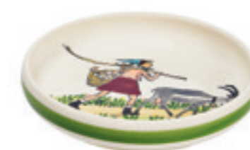
Assiette enfant Flurina avec chèvre Ø 18 cm bord élevé 39502