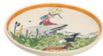
Assiette Flurina sur le rocher Ø 21 cm 39107

pour servir p. ex. des pâtes, des soupes ou du riz