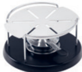
Rechaud* Spécial avec plaque d'aluminium ● revêtement par poudre 32199