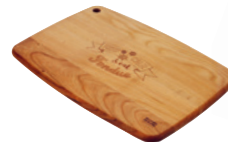
Planche à découper en cerisier Handlettering bois de cerisier 36x25x15 cm ● bois de cerisier 32259