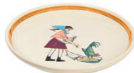
Assiette Flurina Ø 21 cm 39127