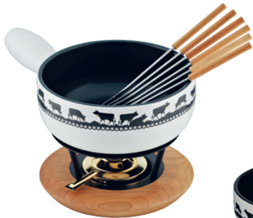
Fondue au fromage Set Induction Goldglocke inclu: Caquelon, réchaud bois de pin*, 6 fourchettes en bois de cerisier, brûleur à pâte garni. Ø 23 cm ● blanc/noir 32243/32289**

Le caquelon „cloche d'or“ séduit par l'impression de silhouette constituée de vaches en train de paître avec des cloches d'or véritable. La bande florale en filigrane vient compléter ce doux dessin. Avec les assiettes à fondue et les tasses assorties, cette série constitue un ensemble de produits harmonieux que vous apprécierez longtemps. Bien entendu, il convient à tous les types de plaques de cuisson, y compris l'induction.