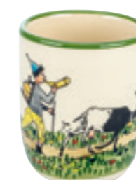
Tasse enfant Ursli avec chèvre 2.0 dl 39341