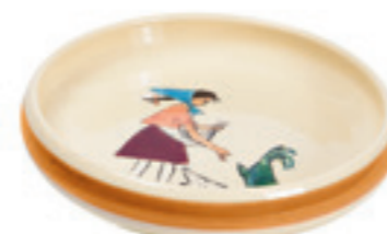
Assiette enfant Flurina Ø 18 cm bord élevé 39517