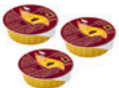
Pâte à brûler pour brûleur Kuhn Rikon 3 pièces à 80 g 32043