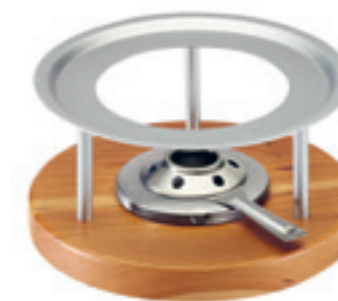
Rechaud* Melchterli ● gris/bois de cerisier 32059