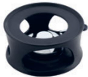
Réchaud Kuhn Rikon Swiss Design* ● noir/céramique 32246