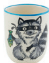
Tasse enfant Raton-laveur 2.0 dl 39329