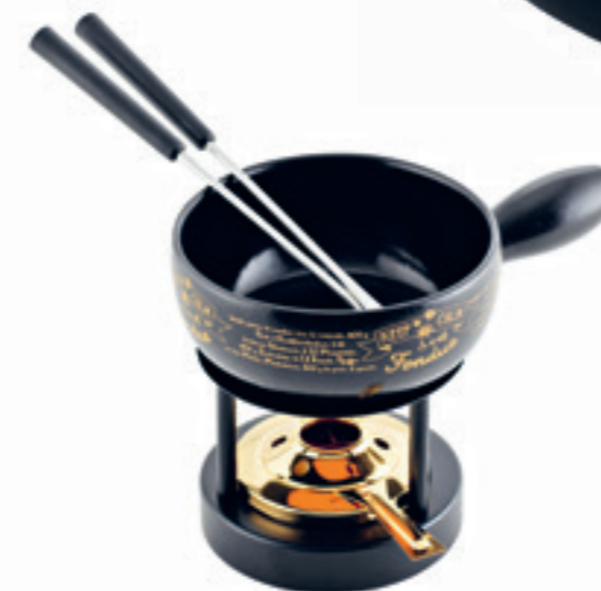
Mini-Fondue au fromage Set Handlettering pour 2 personnes inclu: Caquelon, mini-réchaud*, 2 fourchettes en matière synthétique noires, pâte à brûleur garni. Disponible jusqu'à épuisement des stocks Ø 16 cm ● noir 32256