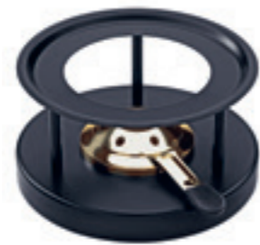
Réchaud* Simple avec brûleur d'or ● noir revêtement par poudre 32263