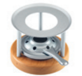
Mini-Rechaud* Melchterli ● gris/bois de cerisier 32244