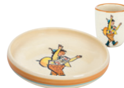
Set pour enfant Ursli Assiette enfant Ø 18 cm bord élevé et tasse enfant 2.0 dl 39540