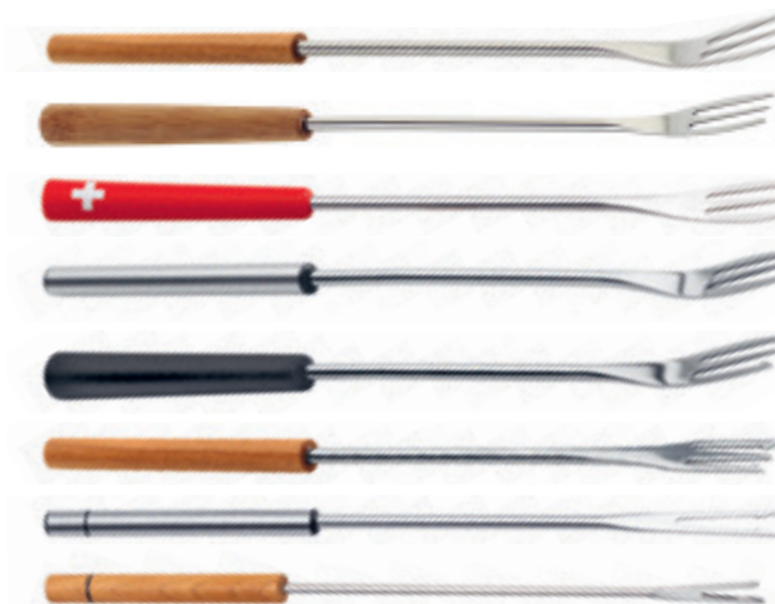
Fourchettes pour Fondue au fromage 6 pièces ● bois de cerisier 32282 NEW