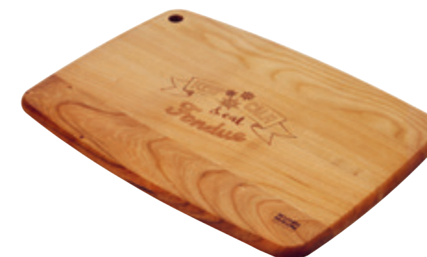
Planche à découper en cerisier Handlettering bois de cerisier 36 x 25 x 15 cm ● bois de cerisier 32259