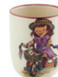
Tasse enfant Bicyclette 2.0 dl 39322