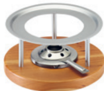
Rechaud* Melchterli ● gris/bois de cerisier 32059