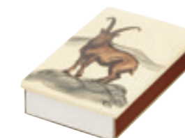
Boîte d'allumettes grande Bouquetin 11.5 x 7cm 39717