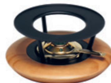
Réchaud* en cerisier avec brûleur d'or ● noir/bois de cerisier 32042