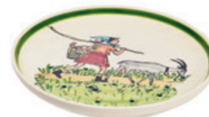
Assiette Flurina avec chèvre Ø 21 cm 39125