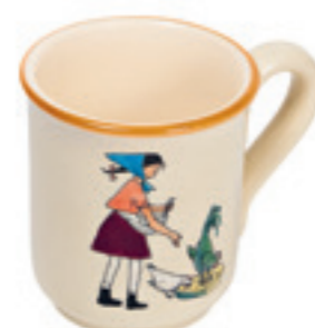
Tasse Flurina 2.8 dl 39459