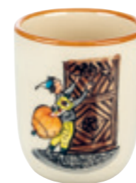
Tasse enfant Ursli au portail 2.0 dl 39343