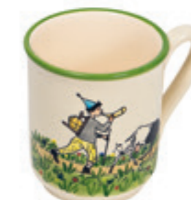
Tasse Ursli avec chèvre 2.8 dl 39455