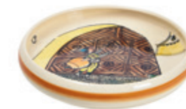
Assiette enfant Ursli au portail Ø 18 cm bord élevé 39511