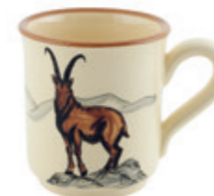
Tasse Bouquetin 2.8 dl 39460