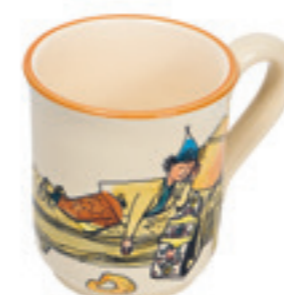
Tasse Ursli dort sur la cloche 2.8 dl 39456