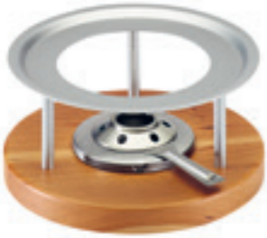
Rechaud* Melchterli ● gris/bois de cerisier 32059