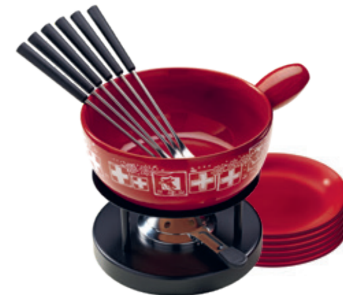
Fondue au fromage Set Suisse inclu: Caquelon, réchaud Simple*, 6 fourchettes en matière synthétique, 6 assiettes rouges, pâte à brûleur garni. Ø 22 cm ● rouge* 32010