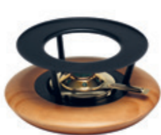
Réchaud* bois de cerisier avec brûleur d'or ● noir/bois de cerisier 32042