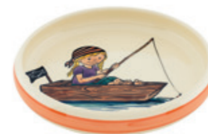
Assiette enfant Pirate fille Ø 18 cm bord élevé 39518