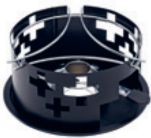
Réchaud* Croix Suisse ● noir revêtement par poudre 32198