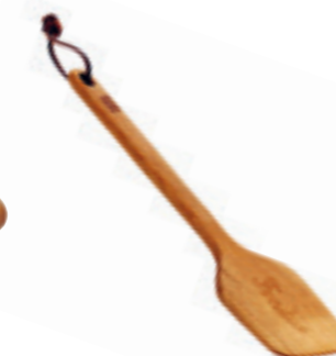
Spatule en cerisier Handlettering bois de cerisier 30 cm ● bois de cerisier 32260