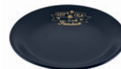
Assiette Handlettering Ø 19 cm ● noir 32258