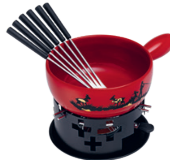
Fondue au fromage Set Alpes inclu: Caquelon, réchaud*, 6 fourchettes en matière synthétique, pâte à brûleur garni. Ø 22 cm ● rouge* 32178