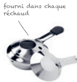
Brûleur à pâte rempli avec pâte à brûler 32046