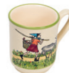
Tasse Flurina avec chèvre 2.8 dl 39450