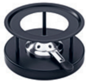
Rechaud* Simple ● noir revêtement par poudre 32019