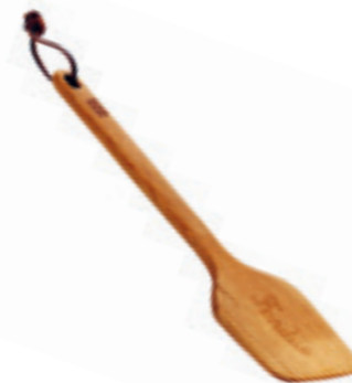
Spatule Handlettering 30 cm ● bois de cerisier 32260