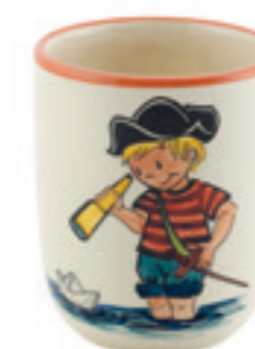
Tasse enfant Pirate garçon 2.0 dl 39325