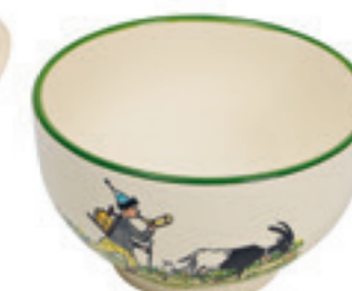
Bol Ursli avec chèvre Ø 14 cm 39484