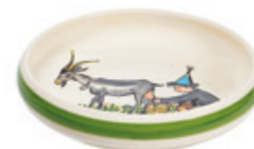
Assiette enfant Ursli avec chèvre Ø 18 cm bord élevé 39514