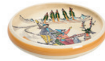
Assiette enfant promenade en luge Ø 18 cm bord élevé 39508